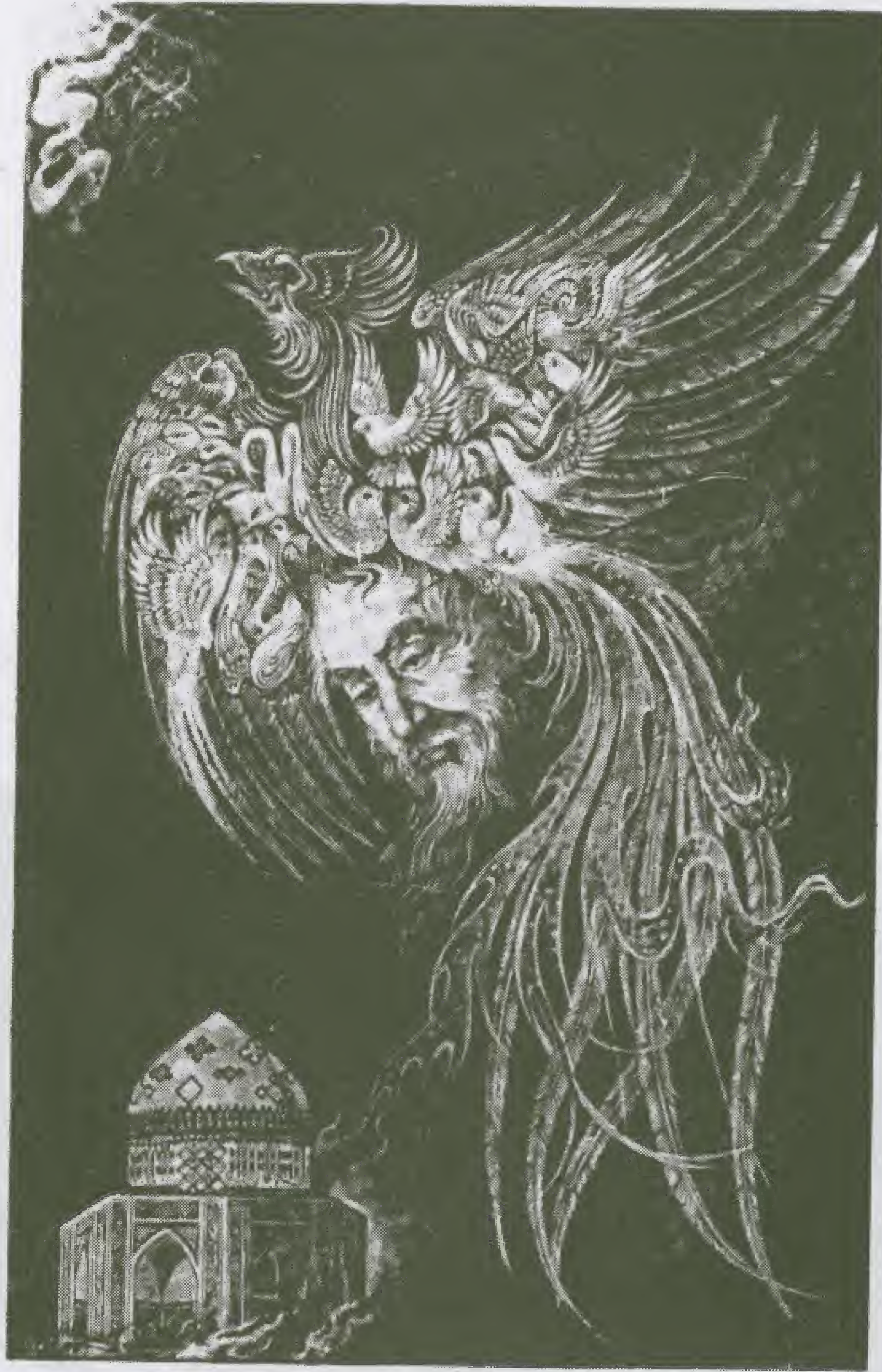
يمثل هذا الرسم (منطق الطير) بريشة الفنان الإيراني محمد صندوقي